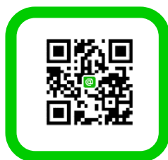
加入 英文系 Line