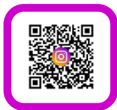
追蹤 英文系 IG